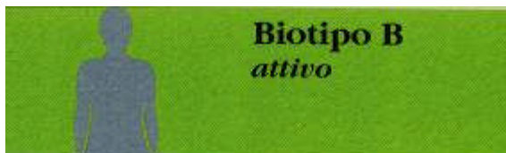
BIOTIPO B Attivo