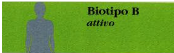
BIOTIPO B Attivo