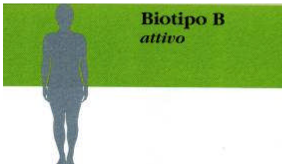
BIOTIPO B Attivo