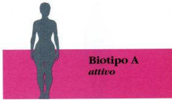
BIOTIPO A Attivo