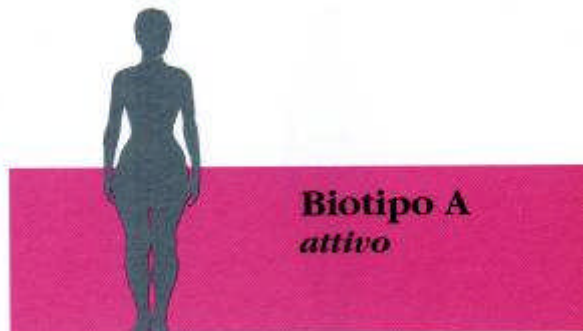
BIOTIPO A Attivo