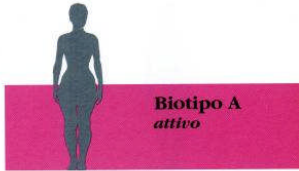
BIOTIPO A Attivo