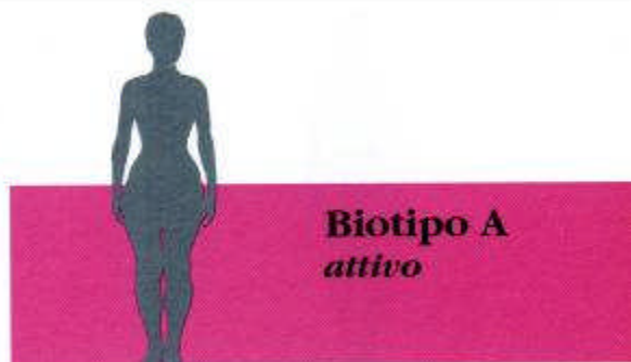
BIOTIPO A Attivo